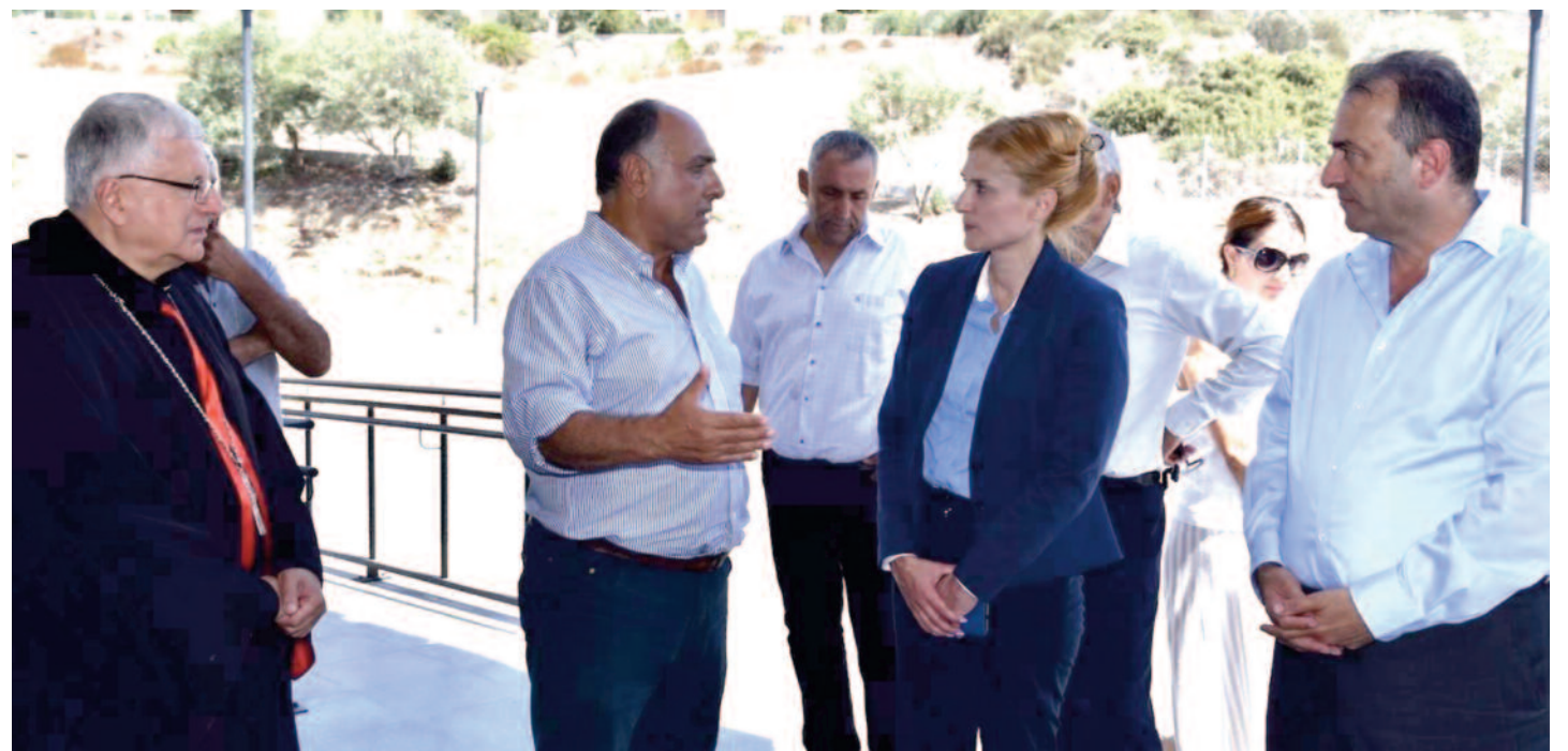
«Η επαναλειτουργία των σχολείων θα συμβάλει στην ενδυνάμωση της ζωής στον Κορμακίτη και τη διατήρηση των στοιχείων της κουλτούρας του»

Συμμετείχατε πρόσφατα μαζί με τους εγκλωβισμένους και επανεγκατασταθέντες, καθώς και άλλους Μαρωνίτες στους εορτασμούς του Τιμίου Σταυρού Καρλάσιας.