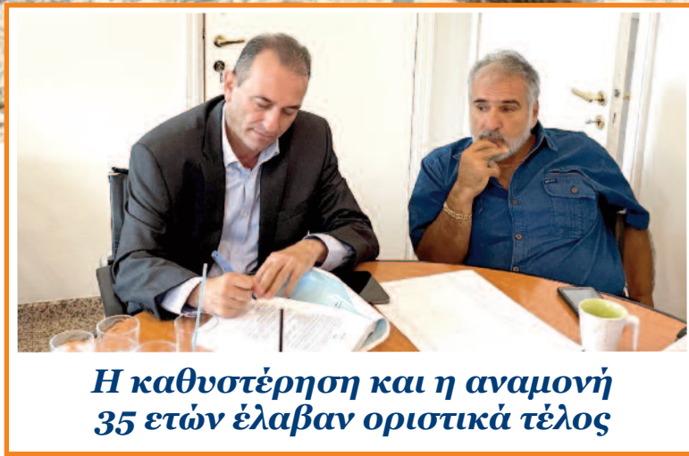
Η καθυστέρηση και η αναμονή 35 ετών έλαβαν οριστικά τέλος