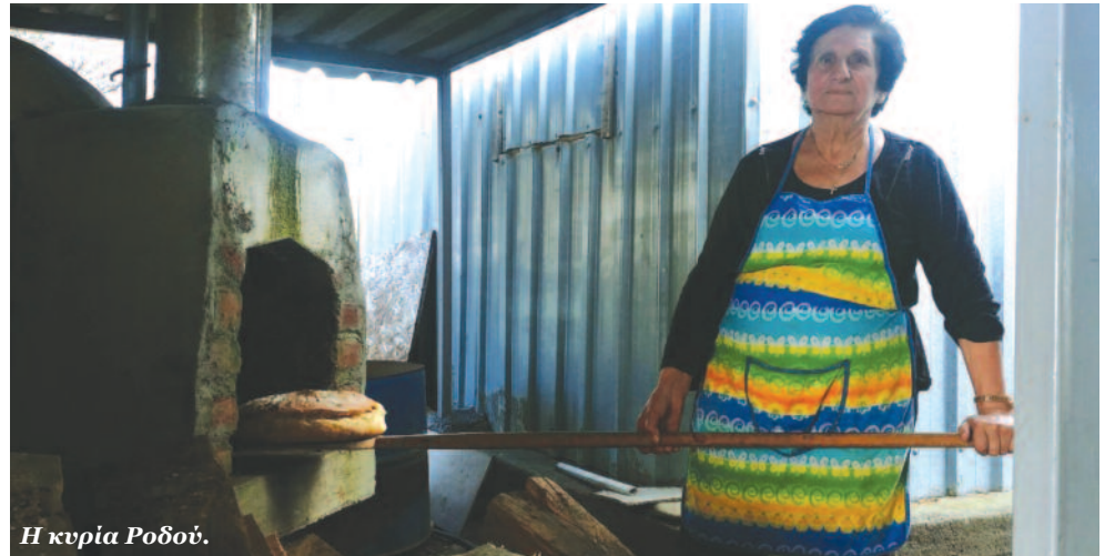
Η κυρία Ροδού.