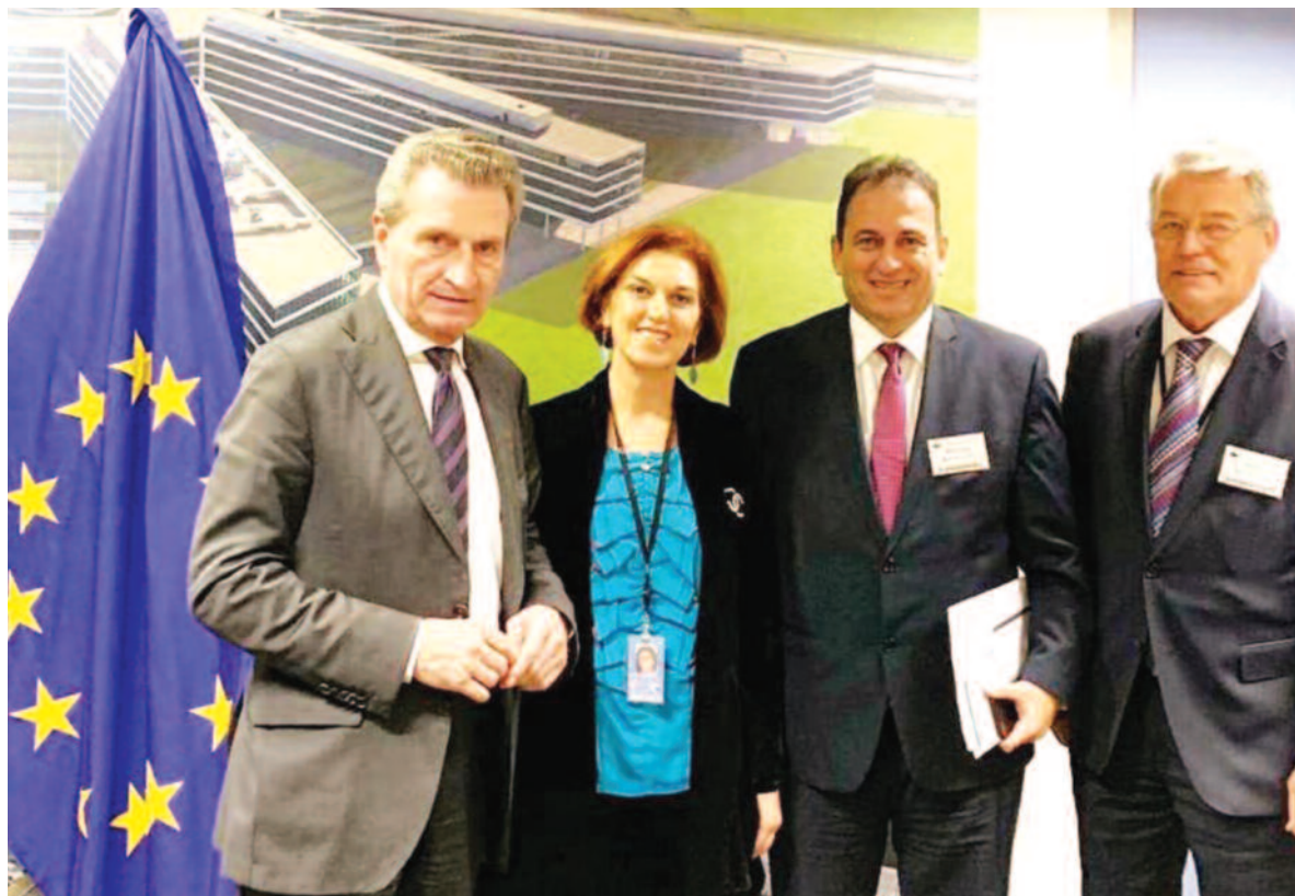
Στη φωτογραφία ο Εκπρόσωπος των Μαρωνιτών με τον Επίτροπο Προϋπολογισμού της Ευρωπαϊκής Ένωσης Γκούνθερ Έτινγκερ, τον Ευρωβουλευτή Ρέιμερ Μπέγκε και τη σύζυγο του Μαρίας Κόκκινου Μπέγκε.

Επίσημη επίσκεψη στην έδρα της Ευρωπαϊκής Ένωσης πραγματοποιήσε ο Εκπρόσωπος της Μαρωνιτικής Κοινότητας Γιαννάκης Μούσας το τριήμερο 18-20 Φεβρουαρίου 2019. Η επίσκεψη του αυτή στις Βρυξέλλες αποτέλεσε, όπως δήλωσε ο ίδιος, σταθμό στην ιστορία της Μαρωνιτικής Κοινότητας της Κύπρου και περιλάμβανε σημαντικές επαφές και συναντήσεις με κορυφαίους αξιωματούχους της Ε.Ε. Με τη στήριξη του Γερμανού Ευρωβουλευτή Ρέιμερ Μπέγκε και της συζύγου του Μαρίας Κόκκινου Μπέγκε, για πρώτη φορά ο ίδιος ο Εκπρόσωπος των Μαρωνιτών έθεσε τα θέματα της Κοινότητας ενώπιον της Ευρώπης, στην επίσημη έδρα της Ευρωπαϊκής Ένωσης. «Η Κοινότητα δήλωσε επιτέλους παρούσα στις Βρυξέλλες, εκεί στην καρδιά της Ευρώπης», δήλωσε χαρακτηριστικά ο Γιαννάκης Μούσας. Με βάση τα λεγόμενά του, «μεταφέραμε στους Ευρωπαίους αξιωματούχους, στην Ευρωπαϊκή Επιτροπή και στο Ευρωπαϊκό Κοινοβούλιο, την αγωνία των Μαρωνιτών για το μέλλον της Κοινότητας τους και ζητήσαμε στήριξη στον αγώνα που διεξάγουμε για σωτηρία και επιβίωση». Σύμφωνα με τον κ. Μούσα, στο επίκεντρο βρέθηκαν οι προσπάθειες για διατήρηση των Μαρωνιτικών χωριών, ρίχνοντας ειδικότατο βάρος στα χωριά Ασώματος και Αγία Μαρίνα. «Βρήκαμε μεγάλη κατανόηση και εξασφαλίσαμε ισχυρή βούληση από την Ευρωπαϊκή Ένωση για στήριξη των προπαθειών μας», συμπλήρωσε. Αυτό που διαφάνηκε με το πέρασμα των επαφών Γιαννάκη Μούσα, σύμφωνα πάντα με τις αναφορές του, είναι η σοβαρή ανταπόκριση που έτυχαν από μέλη της Ε.Ε. τα θέματα της