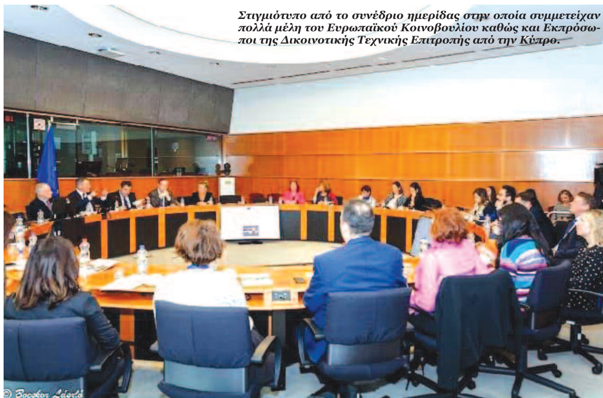
Στιγμιότυπο από το συνέδριο ημερίδας στην οποία συμμετείχαν πολλά μέλη του Ευρωπαϊκού Κοινοβουλίου καθώς και Εκπρόσωποι της Δικαιοτικής Τεχνικής Επιτροπής από την Κύπρο.

Στο πλαίσιο ημερίδας που διοργανώθηκε στο Ευρωπαϊκό Κοινοβούλιο την Τρίτη 19 Φεβρουαρίου 2019, παρουσιάστηκε το πλούσιο έργο της Δικαιοτικής Τεχνικής Επιτροπής για την Πολιτιστική Κληρονομιά, η οποία συστάθηκε πριν δέκα περίπου χρόνια από τους ηγέτες των δύο κοινοτήτων στην Κύπρο. Την ημερίδα διοργάνωσε ο Γερμανός Ευρωβουλευτής Ρέιμπερ Μπέγκε ο οποίος διαδραμάτισε καθοριστικό ρόλο στη σύσταση και μετέπειτα χρηματοδότησή της. Στην ημερίδα παρέστησαν κορυφαίοι αξιωματούχοι του Ευρωπαϊκού Κοινοβουλίου όπως ο Πρόεδρος της Επιτροπής Εξωτερικών Υποθέσεων Ντέιβιντ Μακάλλιστερ, ο Πρόεδρος της Επιτροπής Προϋπολογισμού Ζιαν Αρτουί, η Πρόεδρος της Επιτροπής Ελέγχου του Προϋπολογισμού Γκρέσλε Τγκεμποργκ και πολλοί Ευρωβουλευτές από όλες τις Πολιτικές Ομάδες του Ευρωκοινοβουλίου. Ανάμεσα στους παρόντες Ευρωβουλευτές και οι Κύπριοι Τάκης Χατζηγεωργίου και Νεοκλής Συλικιώτης καθώς και ο Επικεφαλής της Ελληνικής Αντιπροσωπείας Ευρωβουλευτής Γιάννης Κεφαλογιάννης. Παρόντες ακόμη ο εκπρόσωπος της Ευρωπαϊκής Επιτροπής για Θέματα Κύπρου Γκιάρταν Μπίορσον, εκπρόσωποι της Δικαιοτικής Τεχνικής Επιτροπής για την Πολιτιστική Κληρονομιά και του