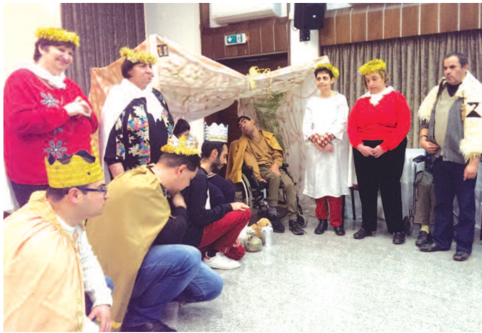
Στιγμιότυπο από την χριστουγεννιάτικη εκδήλωση της οργάνωσης Πίστη και Φως Κύπρου στη Λευκωσία.

είχαν την τιμητική τους με τα παιδιά του Δημοτικού και Νηπιαγωγείου Άγιος Μάρωνας, της Σχολής Τέρρα Σάντα και της Σχολής Αγίας Μαρίας να αναδεικνύουν τα μηνύματα αγάπης των Χριστουγέννων μέσα από τις χριστουγεννιάτικες γιορτές τους. Την καθιερωμένη της ξεχωριστή γιορτή διοργάνωσε και φέτος η οργάνωση Πίστη και Φως, απευθύνοντας κάλεσμα να γίνουμε όλοι αγελιοφόροι χαράς, ιδιαίτερα σε αυτήν την ξεχωριστή περίοδο των Χριστουγέννων. Ενορίες και οργανωμένα σύνολα της Μαρωνιτικής Κοινότητας, σε όλες τις πόλεις, διοργάνωσαν φιλανθρωπικά παζαράκια με στόχο τη στήριξη