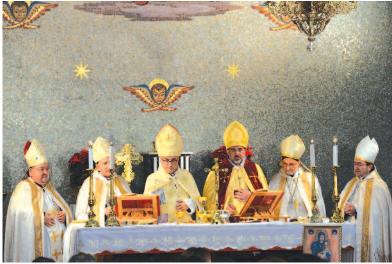
► Πανηγυρικό Συλλείτουργο στον Καθεδρικό Ναό Παναγίας των Χαρϊτων για τα δεκάχρονα του Αρχιεπισκόπου Μαρωνιτών

Το απόγευμα της ίδιας μέρας ο Πρόεδρος της Δημοκρατίας Νίκος Αναστασιάδης τέλεσε τα εγκαίνια του «Σπιτιού του Αγίου Μάρωνα» στη Λευκωσία. Το