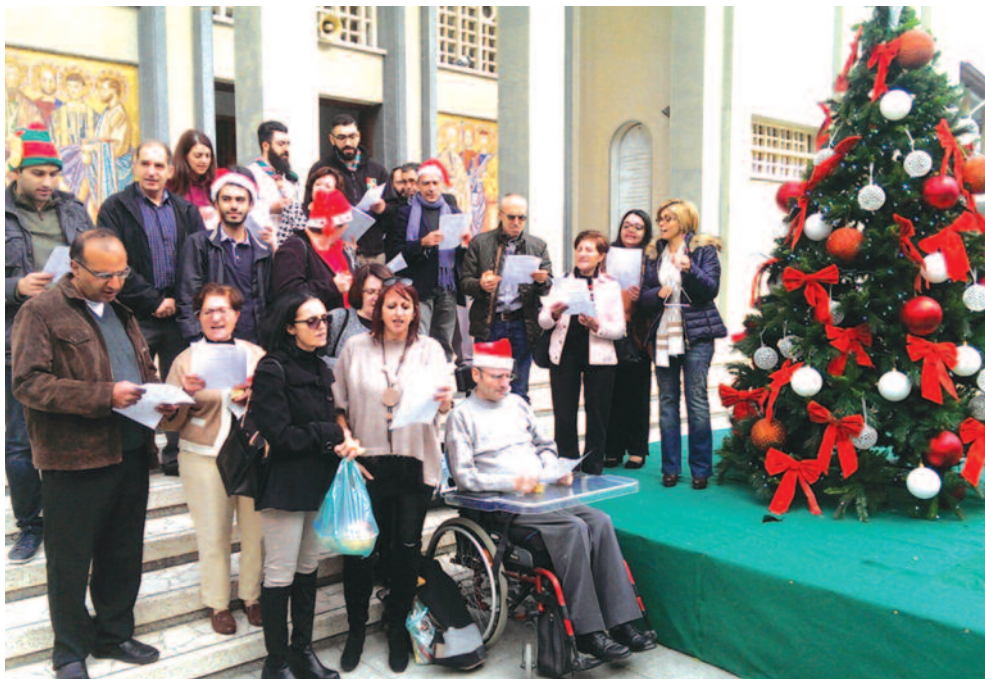
Μαρωνίτες Πρόσκοποι και Πίστη και Φως Κύπρου έψαλλαν τα κάλαντα στο προαύλιο του Καθεδρικού Ναού Παναγίας των Χαρίτων στην Πύλη Πάφου.

Όπως κάθε χρόνο, έτσι και φέτος τα Χριστούγεννα για την κοινότητα των Μαρωνιτών ξεκίνησαν από ωρίς. Ήδη από τις πρώτες μέρες του Δεκέμβρη το χριστουγεννιάτικο δέντρο στην καρδιά των Μαρωνιτών, την Πύλη Πάφου, στήθηκε και φωταγωγήθηκε στο προαύλιο του Καθεδρικού Ναού Παναγίας των Χαρίτων για να σημάνει την έναρξη της εορταστικής περιόδου για τους Μαρωνίτες της Κύπρου. Φιλανθρωπικά παζαράκια, χριστουγεννιάτικες γιορτές, κονσέρτα και άλλες εκδηλώσεις ήταν όλα όσα συνθέταν το εορταστικό σκηνικό και αναμένεται να συνεχιστούν μέχρι και την Πρωτοχρονιά και την έλευση του καινούριου χρόνου. Τα σχολεία