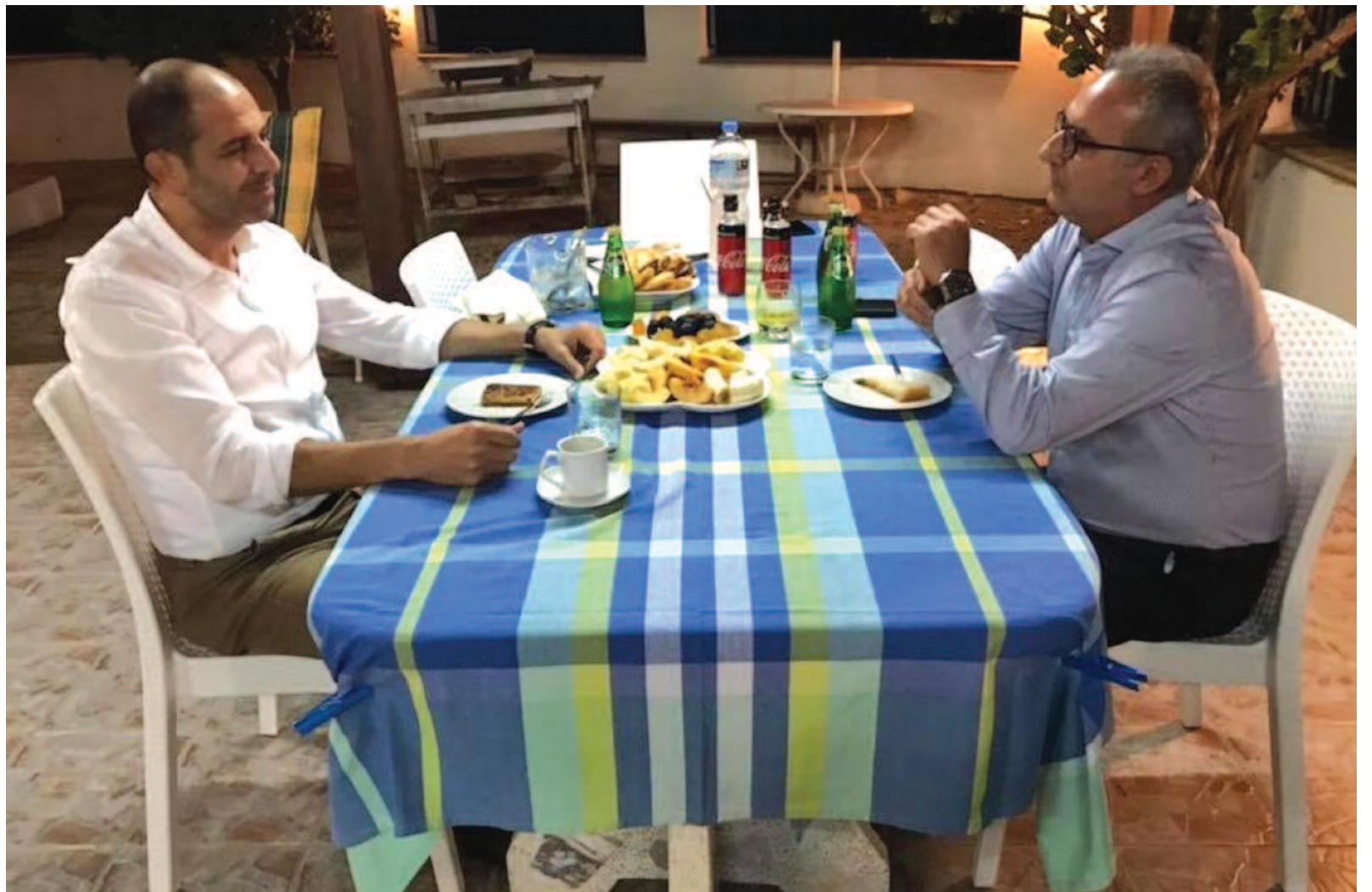
Στιγμιότυπο από το ιστορικό δείπνο Κουντρέτ Οζερσάι-Αβέρωφ Νεοφύτου στον Κορμακίτη το οποίο ανέδειξε με τρανταχτό τρόπο τον γεφυρωτικό ρόλο που μπορεί να διαδραματίσει η Μαρωνίτικη Κοινότητα στην Κύπρο.

Δεν πρέπει να είστε σίγουροι για ορισμένα πράγματα, επειδή δεν είναι μόνο αυτό. Για παράδειγμα, ως πάρομο μια πτυχή που αφορά τους πολίτες. Σε ορισμένα χωριά, μερικά από τα σπίτια χρησιμοποιούνται από το στρατιωτικό προσωπικό, τους συγγενείς τους, όχι για στρατιωτικούς σκοπούς. Αλλά για τα μέλη της οικογένειας και τους συγγενείς ορισμένων υψηλόβαθμων στρατιωτών που ζουν εκεί. Χρησιμοποιούνται για αυτούς τους σκοπούς και δεν έχουν καμία σχέση με τον στρατό. Δεν χρειάζεται να γίνει κάποιο βήμα που αφορά τον στρατό εδώ. Αυτό που χρειάζεται είναι να βρούμε στέγη για αυτούς τους ανθρώπους. Μερικές φορές οι άνθρωποι απλοποιούν τα πράγματα. Λένε ότι το στρατιωτικό καθεστώς είναι το κύριο εμπόδιο. Δεν είναι. Είναι ένα από τα εμπόδια. Πρέπει να το αντιμετωπίσουμε, είναι αλήθεια. Αλλά δεν είμαι βέβαιος ότι αυτό πρέπει να είναι το πρώτο βήμα, γιατί μπορεί να καταλήξουμε στην κατάρρευση του στρατιωτικού καθεστώτος εκεί,